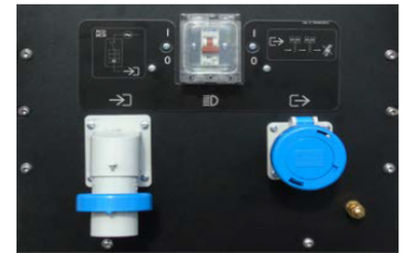
Panel de control estándar

La carrocería de la nueva Linktower T3 ha sido diseñada para ofrecer una mejor protección ante la lluvia al panel de control.